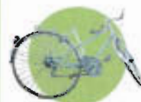
Métaux : ferreux et non ferreux