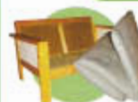
Encombrants : matelas, meubles...