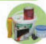
Déchets toxiques : piles, peintures, solvants...