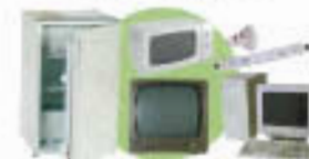
Déchets d'Equipements Electroniques et Electroniques (DEEE)

Ces déchets ne doivent être déposés ni à l'intérieur, ni à côté des conteneurs. Merci !