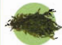
Végétaux : herbe, feuilles, branches...