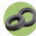
Pneus : d'auto ou moto