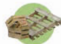
Bois non traité : Palettes, caissettes