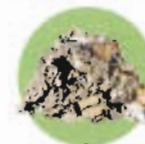
Gravats : démolition, briques, tuiles...