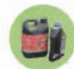
Huile de moteur Huile alimentaire